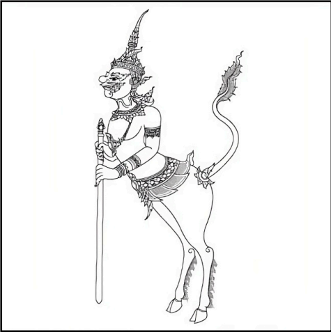
- Une creature mythique de Thaïlande

Les bouddhistes Thaïlandais croient plutôt dans la réincarnation sous forme animale. Par exemple, dans une histoire de Pla boo Thong: L'âme d'une mère souffrante se réincarne dans le corps d'un poisson pour prendre soin de sa fille. Un autre exemple: Un Thaïlandais a épousé un serpent parce qu'il croyait que c'était la réincarnation de sa femme décédée. Ils croient aussi que un aniamle qui est "déformé", est un esprit d'une personne réincarnée; beaucoup de thaïlandais pensent que les animaux déformés portent bonheur.