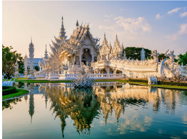
- Thaïlande: Temple Bouddhist